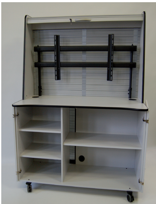
DS55-1 Frontansicht geöffnet (Ansichtsmodell DS55-2 lichtgrau)