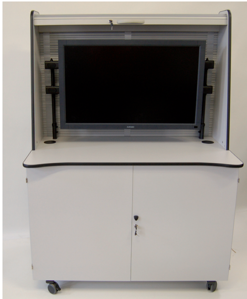
DS55-1 Frontansicht geöffnet und mit Beispieldisplay ausgestattet (Ansichtsmodell DS55-2 lichtgrau)