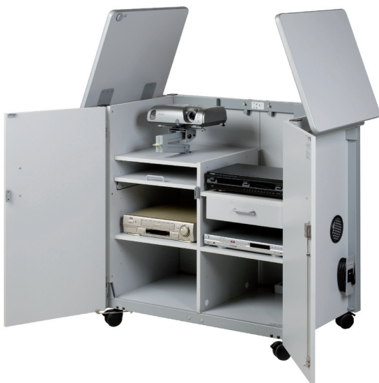
Frontansicht geöffnet Projektorarm eingeklappt ausgestattet

Der MS1100 ist ein mobiler, abschließbarer Medienschränk (zentrales Schließsystem), der für die praktische Verwendung eines Overheadprojektors und anderer AV-IT-Medientechnik (PCs, Notebooks, Dokumentenkameras etc.) im Klassenraum entwickelt wurde. Er verfügt über eine integrierte Fünffachsteckdose, 5 m Stromkabel, ein variabel einsetzbares Ablagefach, ein ausziehbares Fach für Notebook oder PC-Tastatur und eine Schublade. Der Metallrahmen ist durchgehend und an allen vier Seiten sowie an der Unterseite des Schränks angebracht. Auf diese Weise ist höchstmögliche Stabilität gewährleistet. Die obere Abstellfläche kann in zwei Teilen geöffnet werden und als zusätzliche Stellfläche dienen, wobei Gasdruckdämpfer verhindern, dass die Abstellflächen zu schnell ausklappen. Der MS1100 kann sowohl von vorne als auch von hinten geöffnet werden (die Türen auf der Rückseite öffnen aus Sicherheitsgründen nur, wenn Türen vorne geöffnet sind). Der Projektorarm ist mit einer Universalaufnahmeplatte für alle Projektorentypen (bis 10 kg Gewicht) ausgestattet, der über einen leichtgängigen Mechanismus ausgefahren werden kann. Der Metallrahmen gewährleistet höchste Stabilität. Der Schrank eignet sich auch perfekt für die Aufnahme der Arcus-Overheadprojektorenmodelle (Art.-Nr.: 310010080 und 310010081).